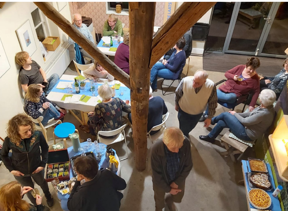
In 2020 waren bij Stichting Renkums Beekdal 99 vrijwilligers actief